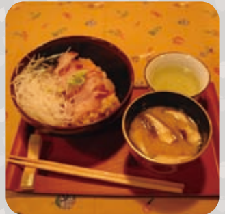
원하는 반찬들을 골라서 댕밥으로 하세요 드실때는 대학당에서 맛있게 !!!

밥은 작은 것은 100엔 중간 것은 150엔 큰 것은 200엔입니다. 매일 손수 만든 찌개는 100엔입니다. 녹차나 간장 등은 대학당에 있습니다.