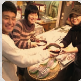
그 밥을 한쪽 손에 들고 시장으로 나가서.