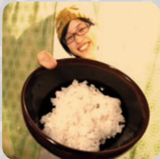
대학당에서 밥을 사서.